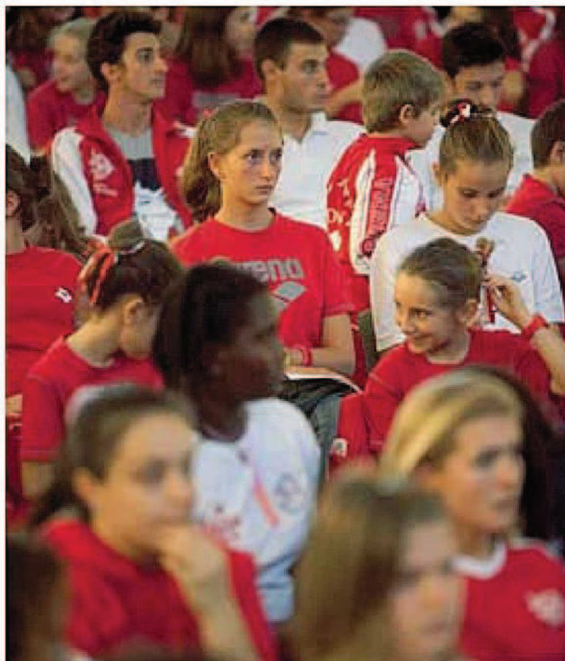
avolo nuoto fino alle squadre

Per salvaguardare il futuro della Rari nella prossima Giunta sarà ratificata la convenzio-